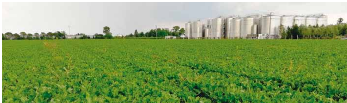
Biogas San Vittorio