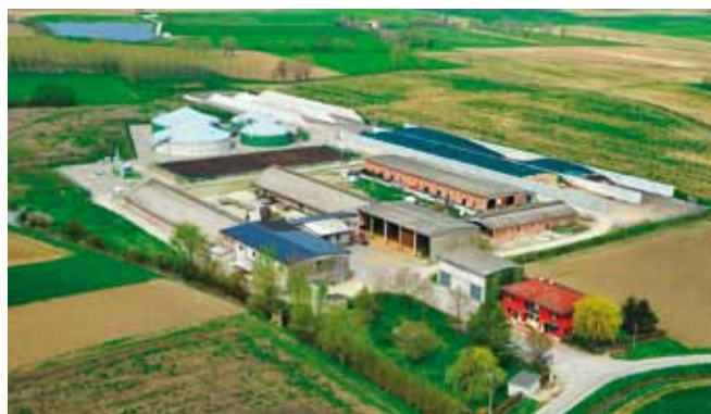
Biogas Tessagli Agroenergia a Comessaggio (Mn)

no di origine agricola rispetto a quanto viene garantito dal ritiro GSE. A tal proposito, da una idea di CGBI, è stata di recente costituita "Verdemetano" ( www.verdemetano.it ), la prima cooperativa agricola con lo scopo di aggregare e valorizzare la produzione di biometano arrivando alla vendita dello stesso al consumatore finale».