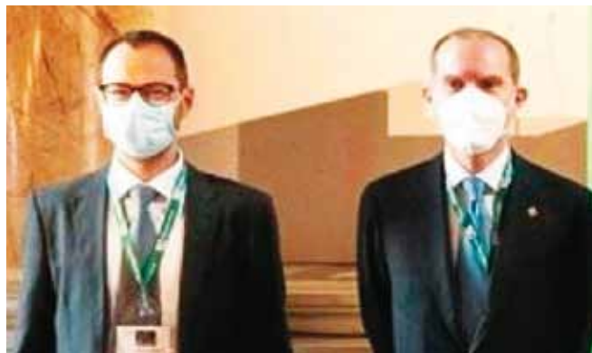
A sinistra Ministro Patuanelli e Presidente di Confagricoltura Giansanti

Sottosegretari di Stato sono stati nominati Francesco Battiston di Forza Italia e Gian Marco Centinaio della Lega, già ministro nel primo governo Conte.