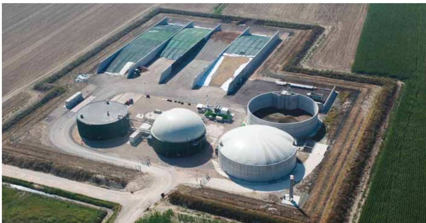
Biogas Emiliana Agroenergia a Besenzone (Pc)

«L'Associazione ha sviluppato negli anni una visione moderna e innovativa che è quella di incrementare il reddito degli agricoltori accrescendo anche la sostenibilità ambientale delle produzioni. Il tutto attraverso la creazione di filiere agroindustriali, che possano garantire agli associati interessanti opportunità commerciali, ossia: minor costi logistici e una forza maggiore nelle trattative con il cliente finale».