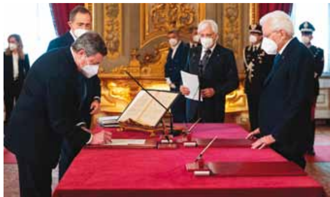
Il Presidente del Consiglio, Mario Draghi, giura nelle mani del Presidente della Repubblica Sergio Mattarella.

Affari Esteri e Cooperazione internazionale: Luigi Di Maio; Interno: Luciana Lamorgese; Giustizia: Marta Cartabia; Difesa: Lorenzo Guerini; Economia e Finanze: Daniele Franco; Sviluppo economico: Giancarlo Giorgetti; Politiche agricole alimentari e forestali: Stefano Patuanelli; Ambiente, tutela del territorio e del mare: Roberto Cingolani; Infrastrutture e trasporti: Enrico Giovannini; Lavoro e politiche sociali: Andrea Orlando; Istruzione: Patrizio Bianchi; Università e ricerca: Maria Cristina Messa; Beni e attività culturali e turismo: Dario Franceschini; Salute: Roberto Speranza.