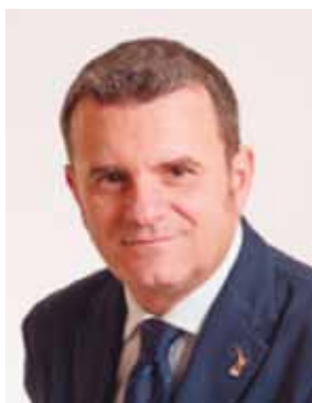
Gian Marco Centinaio