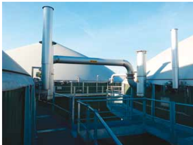
Biogas Galastena Energy a Copparo (Fe)

«ANB, e più in generale di CGBI guardano adesso alla frontiera del biometano. Ormai tutte le aziende, in ogni settore, sono orientate a profili di sostenibilità sempre più elevati. La decarbonizzazione è il tema centrale della politica ambientale nazionale ed europea. Nel trasporto merci e nella mobilità pubblica, il biometano avanzato rappresenta il principale carburante, da fonti rinnovabili, impiegabile nel breve-medio termine. Tuttavia, la fattibilità dei progetti dipende soprattutto da una migliore valorizzazione commerciale del biometano